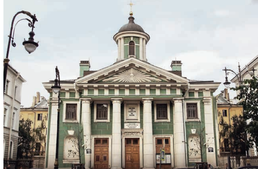
Кафедральный собор Святой Марии. Большая Конюшенная, д. 8А